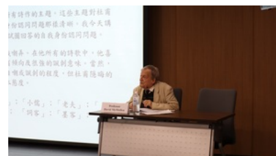
講者演說實景。