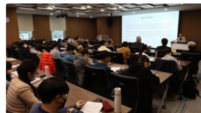
羅家倫講堂參與師生專注聆聽。